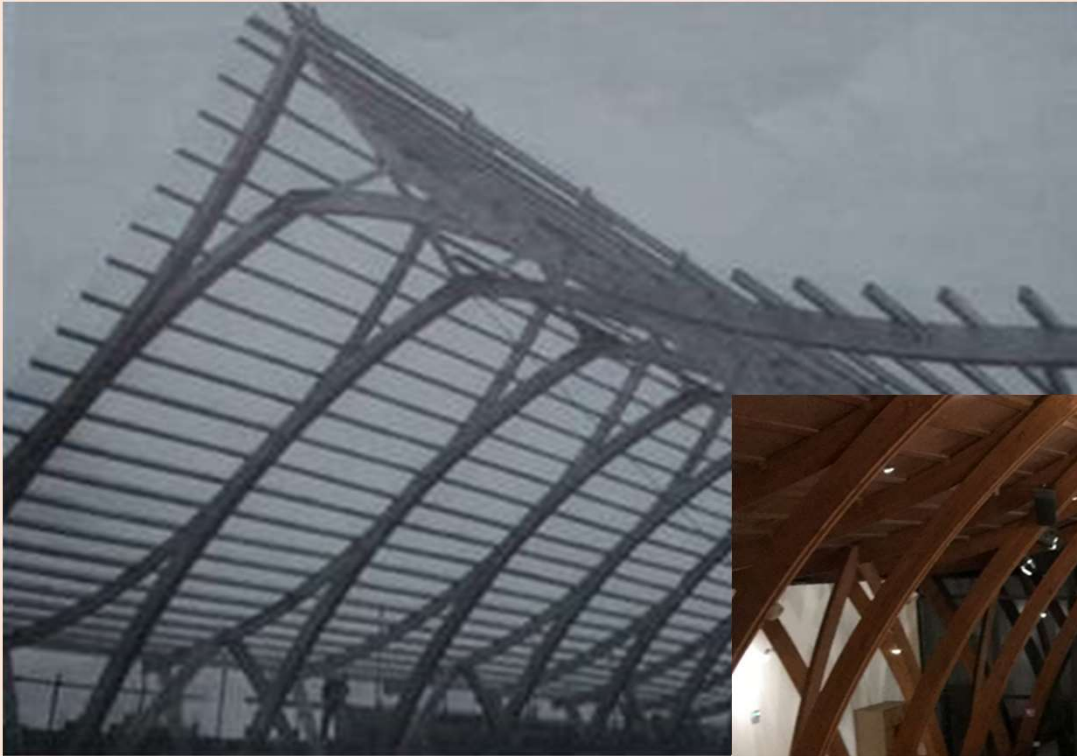
Lors de sa construction en 1966