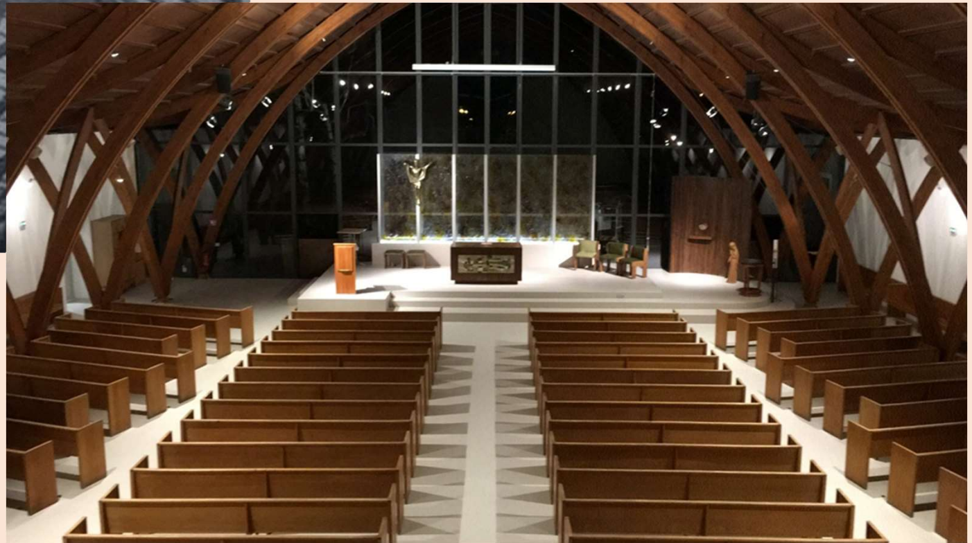
Lors de la rénovation en 2022