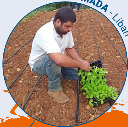
MADA - Liban